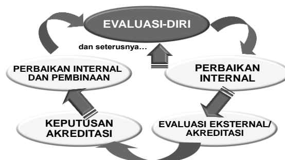
Bagan 1. Daur Penjaminan Mutu dalam Rangka Akreditasi

Seperti dikemukakan terdahulu, evaluasi-diri merupakan salah satu aspek penting dalam keseluruhan daur akreditasi dengan berbagai peran dan kegunaannya, termasuk penjaminan mutu ( quality assurance ). Keseluruhan daur penjaminan mutu dalam rangka akreditasi program studi/ perguruan tinggi itu dilukiskan dalam Bagan 1.